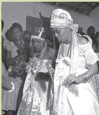
Cérémonie de Candomblé Fondation Pierre Verger, Salvador de Bahia, Brésil