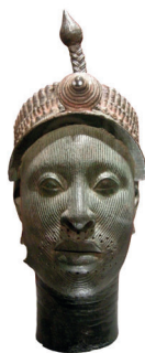
Tête d'Ife British Museum, Londres

Influences des cultures yoruba sur le Candomblé Le Candomblé a été très marquée par le patrimoine culturel Yoruba. Leur religion, l'Ifa, est centrée sur le culte des Orishas, des divinités associées aux phénomènes naturels et aux ancêtres. Dans le Candomblé, les Orishas sont devenus les « orixás », des figures centrales de la pratique religieuse. Les yoruba ont contribué avec leur mythologie complexe, à l'histoire des Orishas, les chants, les rythmes et les danses qui sont fondamentaux dans les rituels du Candomblé. L'utilisation d'instruments de musique comme le tambour bata, ainsi que l'importance des prêtres appelés « babalorixá » ou « ialorixá », est dérivée des traditions yorubas.