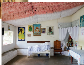
Terreiro Rumpame Ayono Runtólogi, Bahia, Brazil