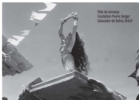
Fête de Iemanjá Fondation Pierre Verger Salvador de Bahia, Brésil

Représentée par une sirène, sa statue est visible dans presque toutes les villes de la côte brésilienne. Les fils et filles de Iemanjá sont de bonnes mères et de bons pères. Ils protègent leurs enfants, leurs amis et leurs proches comme des lions. Leur plus grand défaut est de trop parler.