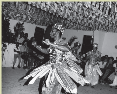
Rite pour Xangô, Fondation Pierre Verger Salvador de Bahia, Brésil

Une personne de Xangô aime avoir beaucoup d'amants, même si elle n'a pas la puissance sexuelle nécessaire pour maintenir plus d'une relation pendant longtemps. Ils vivent pour se battre, pour impliquer les gens dans leurs propres guerres personnelles. Ils aiment se battre, même s'ils grossissent les exploits, et l'on dit qu'un Shangô est le juge le plus juste que l'on puisse souhaiter.